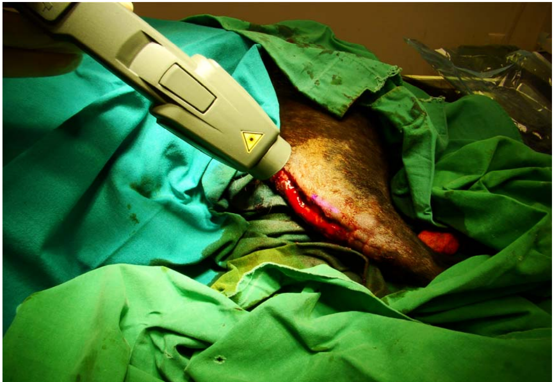
Spodnja slika prikazuje odprto rano na levem kolenu, 24 ur po prvem obsevanju z laserjem: