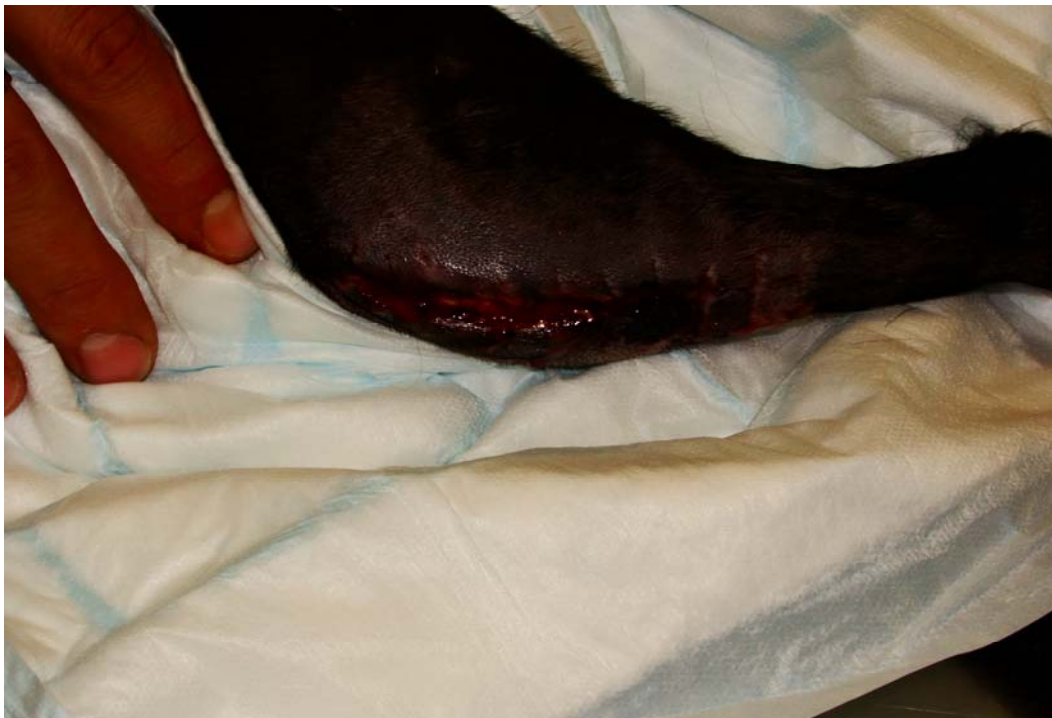
Naslednje 3 slike prikazujejo stanje odprte rane na levem kolenu, 3., 4. in 5. dan zdravljenja: